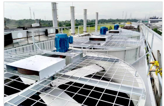
Danarmas 纺织行业项目 DANARMAS TEXTILE PROJECT